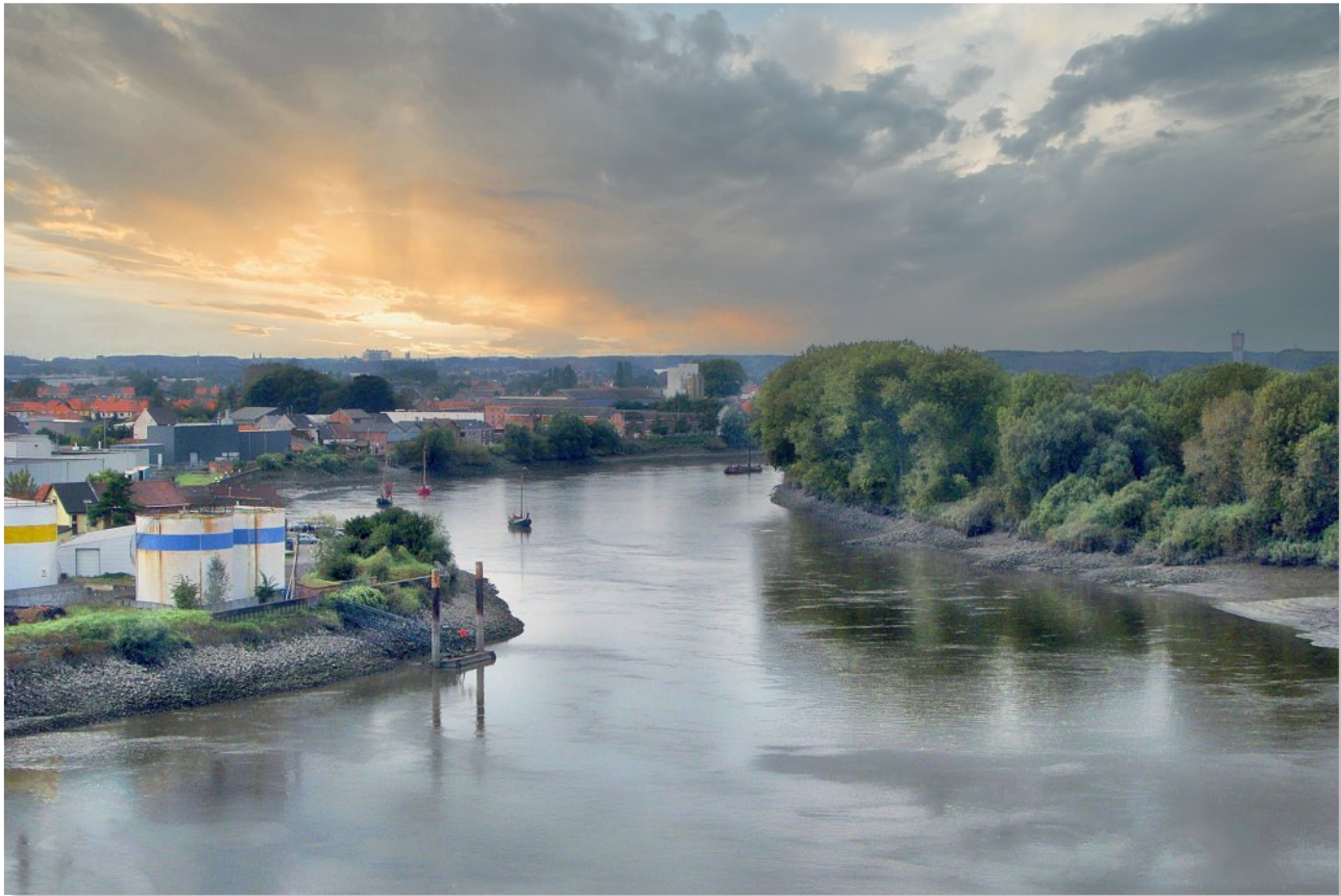
Zicht op de schelde Baasrode